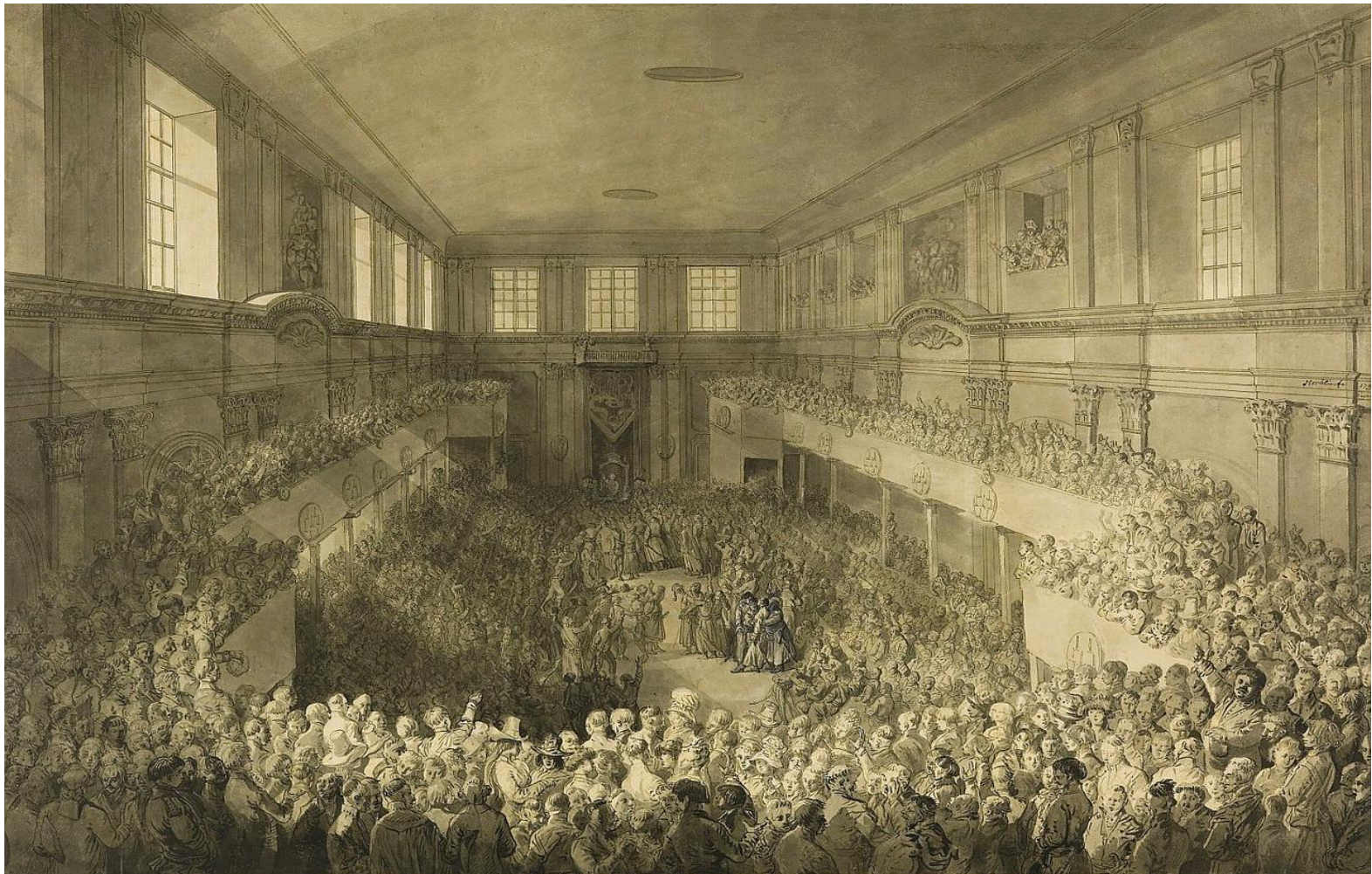
Zaprzysiężenie Konstytucji 3 maja w Sali Senatorskiej na Zamku Królewskim w Warszawie, rysunek Jana Piotra Norblina