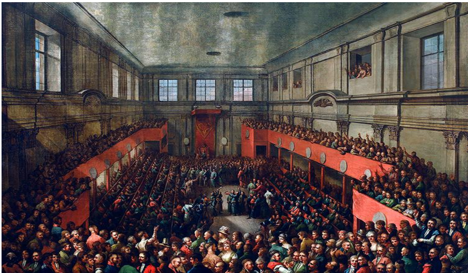
Uchwalenie Konstytucji 3 maja 1791 roku, obraz Kazimierza Wojniakowskiego z 1806 roku