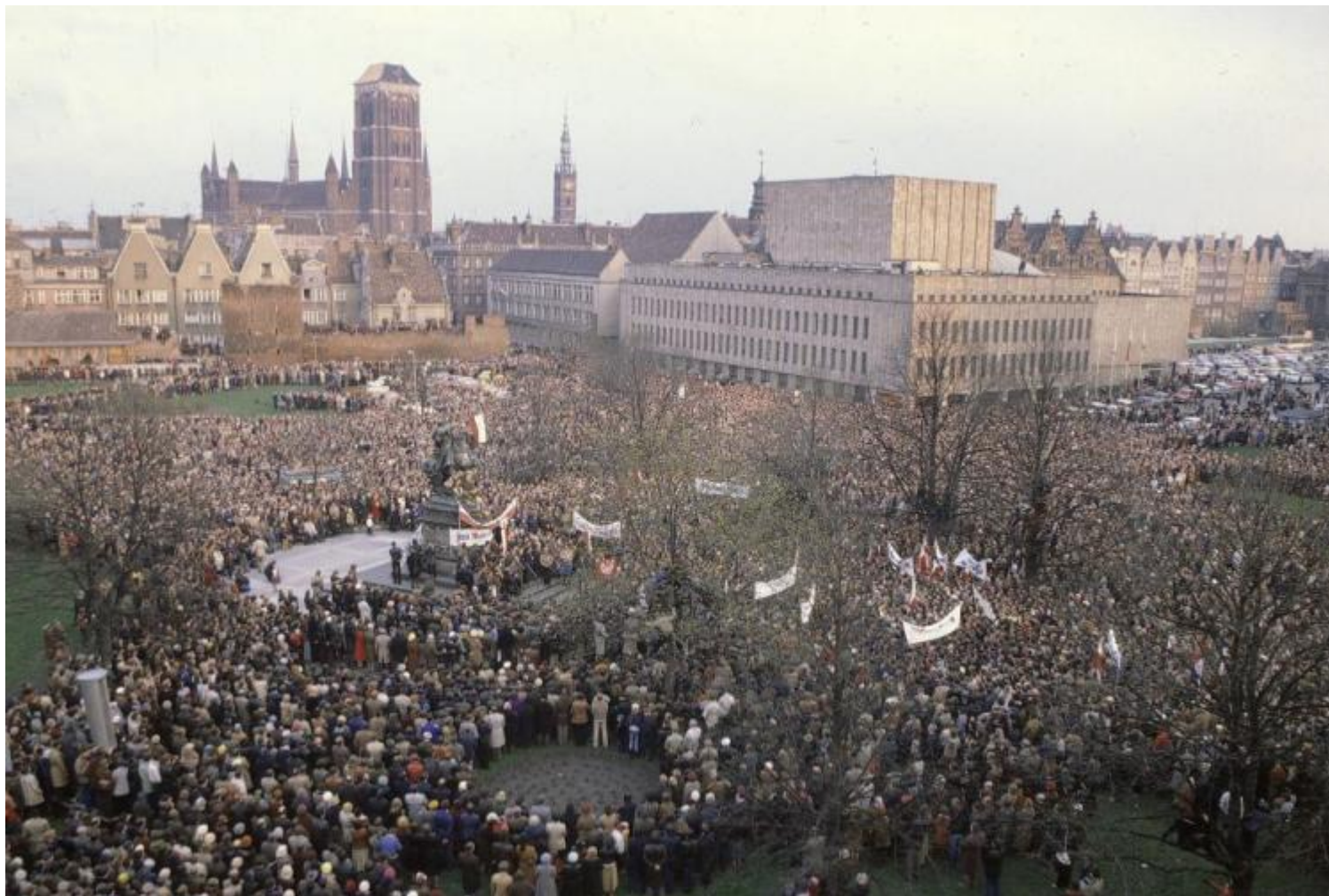
Obchody 190. rocznicy uchwalenia Konstytucji 3 Maja. Gdańsk, 1981