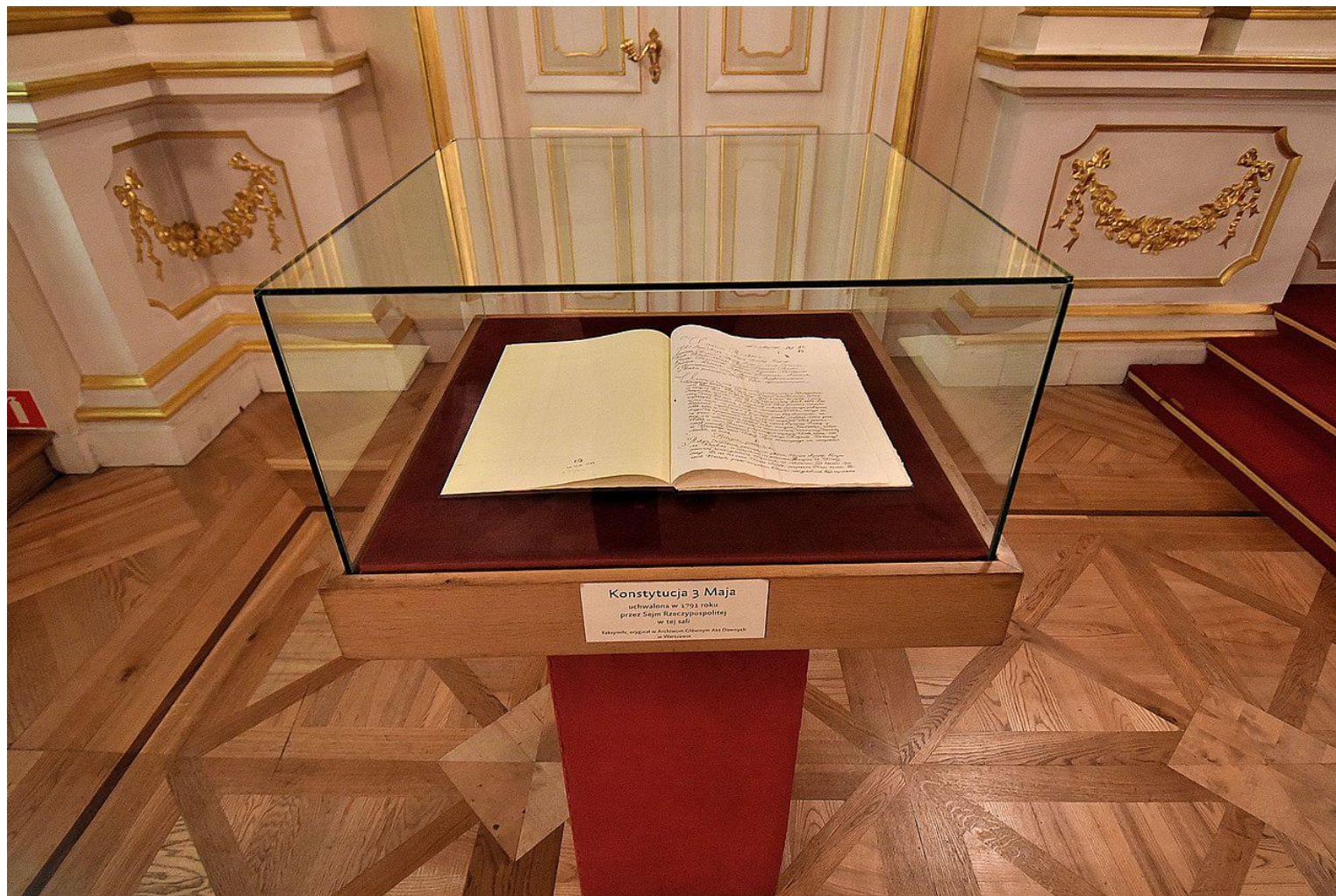
Konstytucja 3 Maja uchwalona w 1791 roku przez Sejm Rzeczypospolitej w tej sali Replika, oryginał w Archiwum Ordynacji w Warszawie