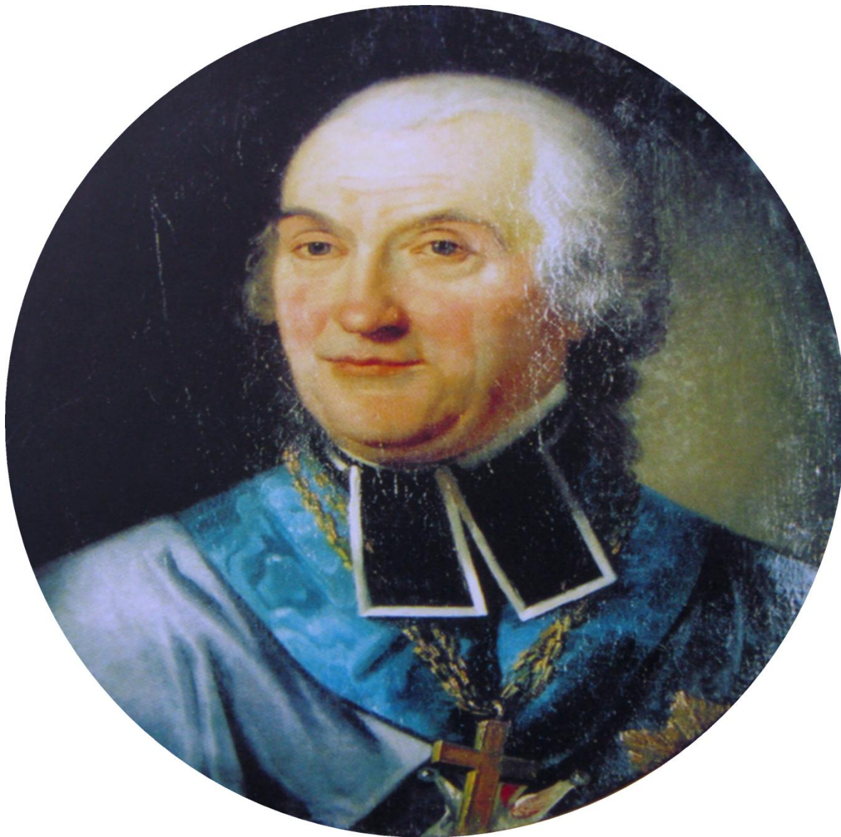
Adam Krasiński jeden z twórców konstytucji