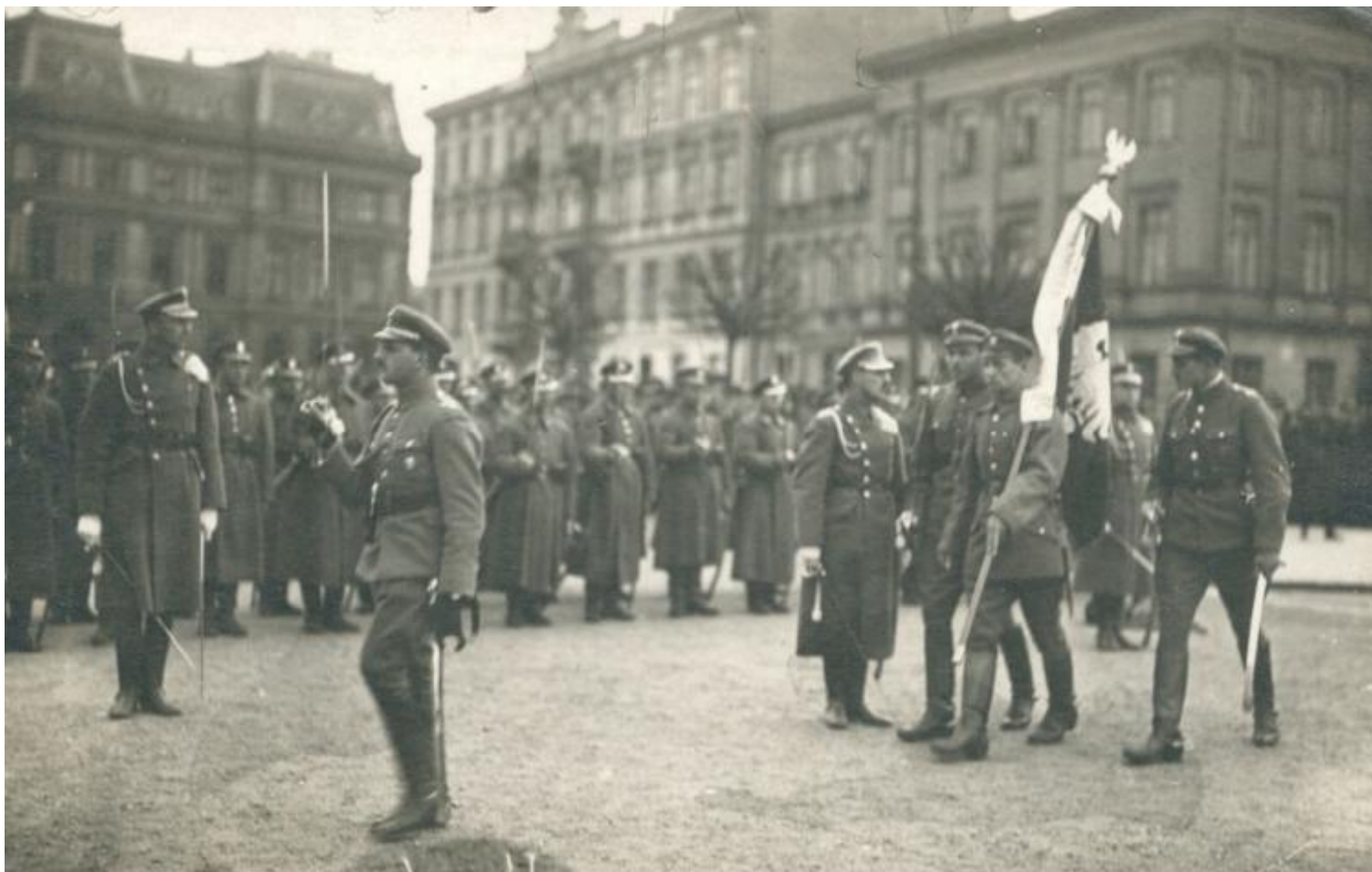
Obchody Święta 3 maja w Warszawie 1919 r.