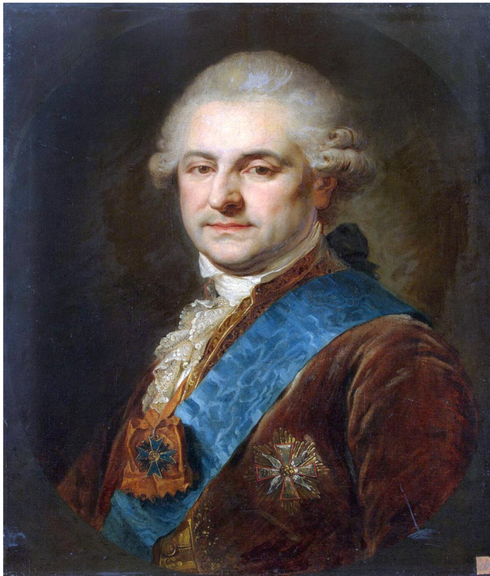
Król Stanisław August Poniatowski jeden z autorów Konstytucji 3 maja