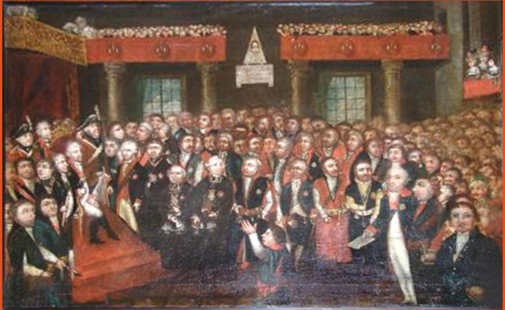
Ogłoszenie Konstytucji 3 maja 1791 roku