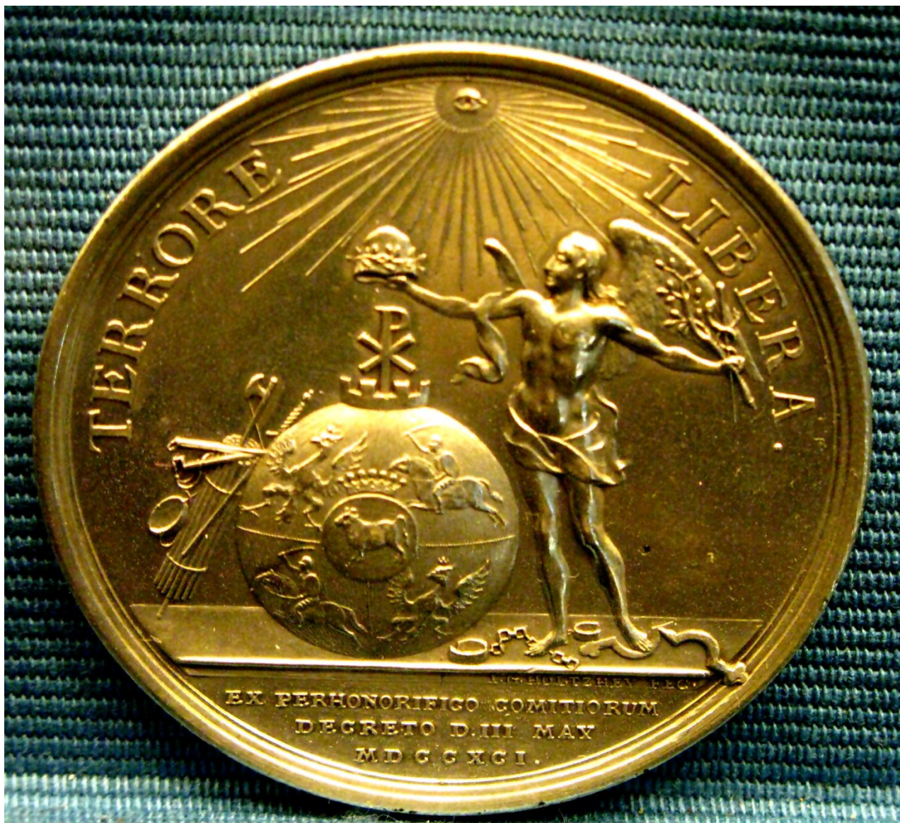
Medal wybity w 1791 z okazji uchwalenia Konstytucji 3 maja