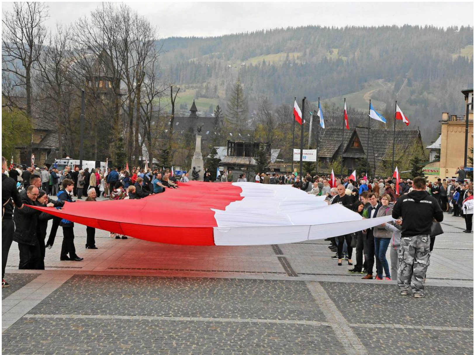
Obchody święta w Zakopanem